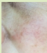
Avant le traitement