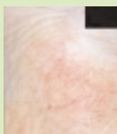
Avant le traitement