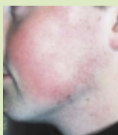
Avant le traitement