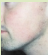
Après deux séances